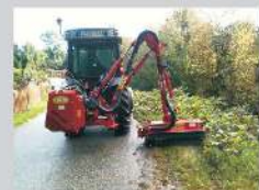
NTP 470 in Arbeitsposition