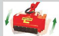
Schwimmstellung für automatische Bodenadaptation