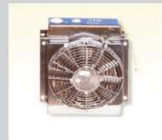
Hydraulikölkühler mit Ventilator