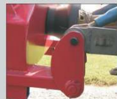
Mechanische Anfahrssicherung mit automatischer Rückstellung Optional: Hydraulische Anfahrssicherung möglich