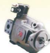
Kolbenpumpe und Kolbenmotor (optional)