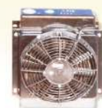
Hydraulikölkühler mit Ventilator