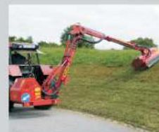
DPS 720 in Arbeitsstellung