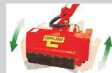
Schwimmstellung für automatische Bodenanpassung