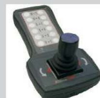
Neue Joystick-Steuerung PA 200